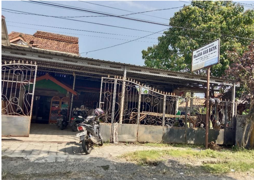
Gambar 3. 2 Foto Lokasi Penelitian

Penelitian ini di mulai pada tanggal 1 Agustus 2024 sampai dengan 31 Januari 2025. Berikut adalah rincian qakru penelitian dalam bentuk gantt chart :