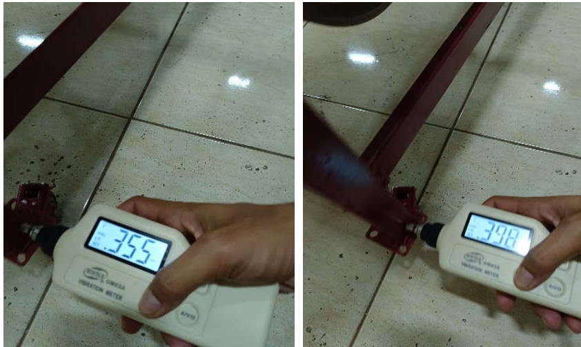
Pengukuran Amplitudo pada titik suspensi kanan