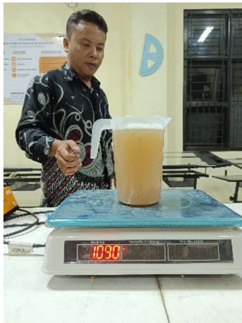
Air Hasil Penirisan Kedelai