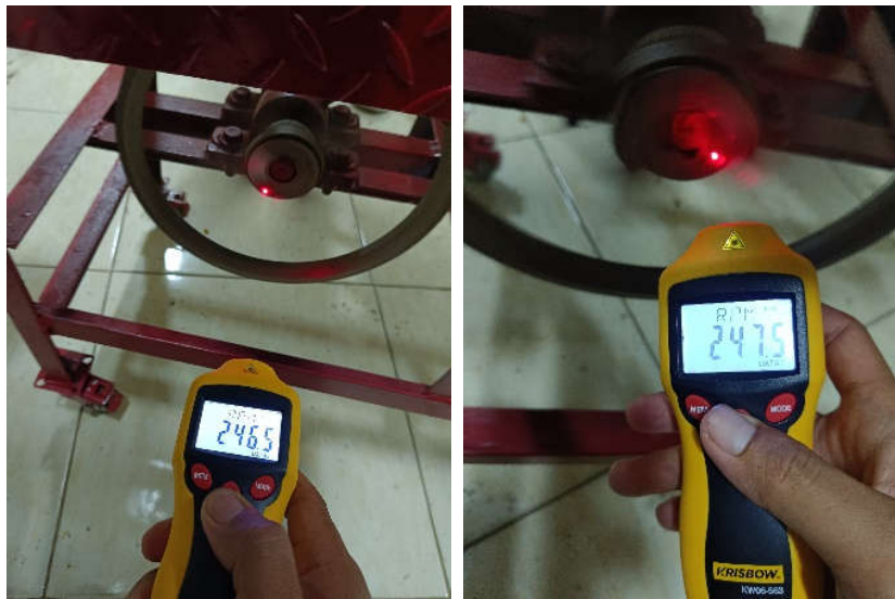
Pengukuran Kecepatan Putar Menggunakan Tachometer