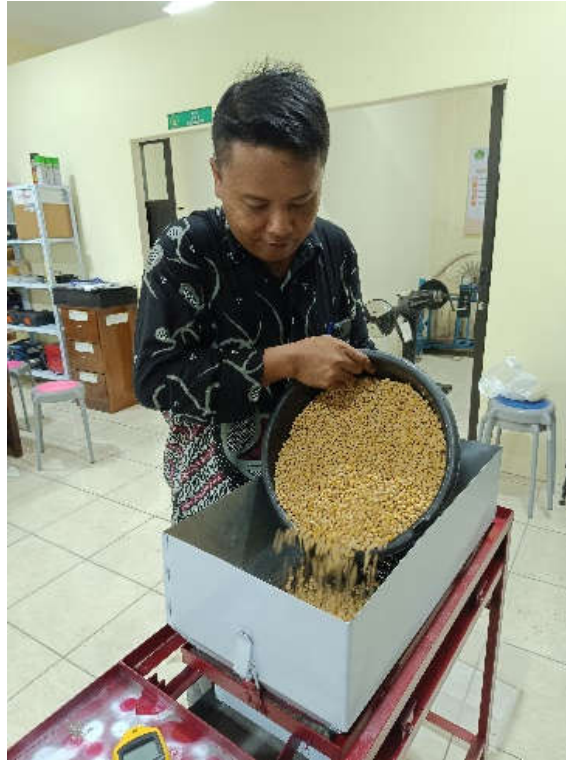
Proses Pemasukan Kedelai yang akan ditiriskan