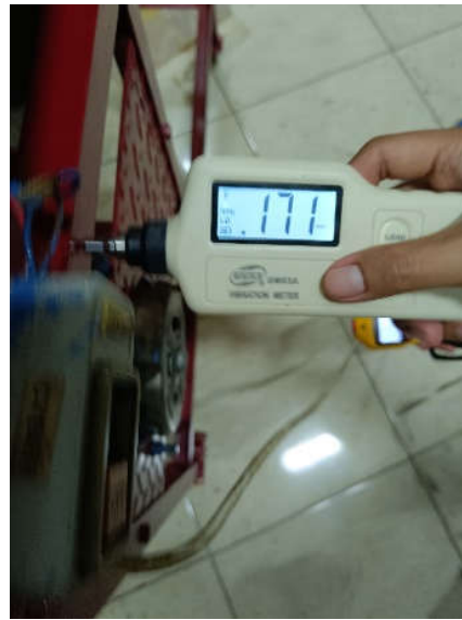
Pengukuran Amplitudo Getaran