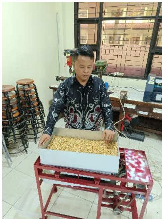
Proses Penirisan Kedelai menggunakan Mesin