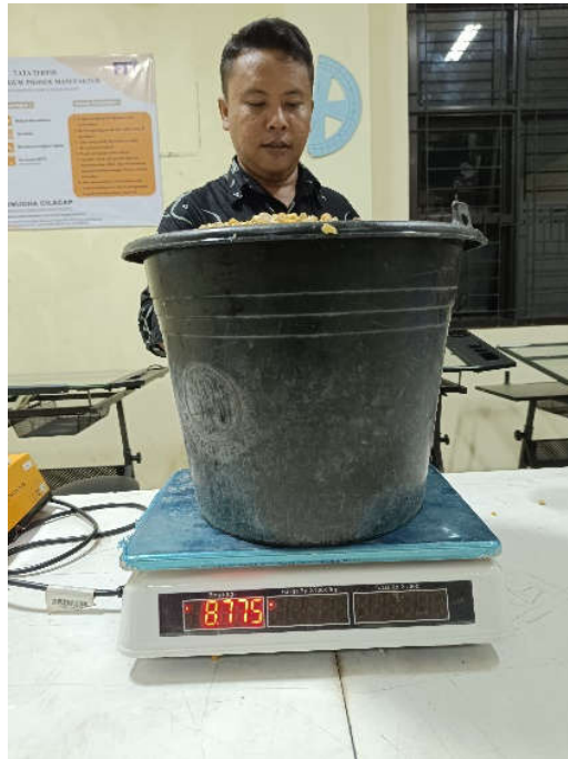
Proses Penimbangan setelah ditiriskan