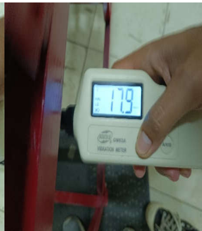
Kecepatan Getaran (mm/s) di titik output penirisan