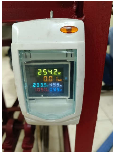
Kontrol Panel Mesin Peniris Kedelai